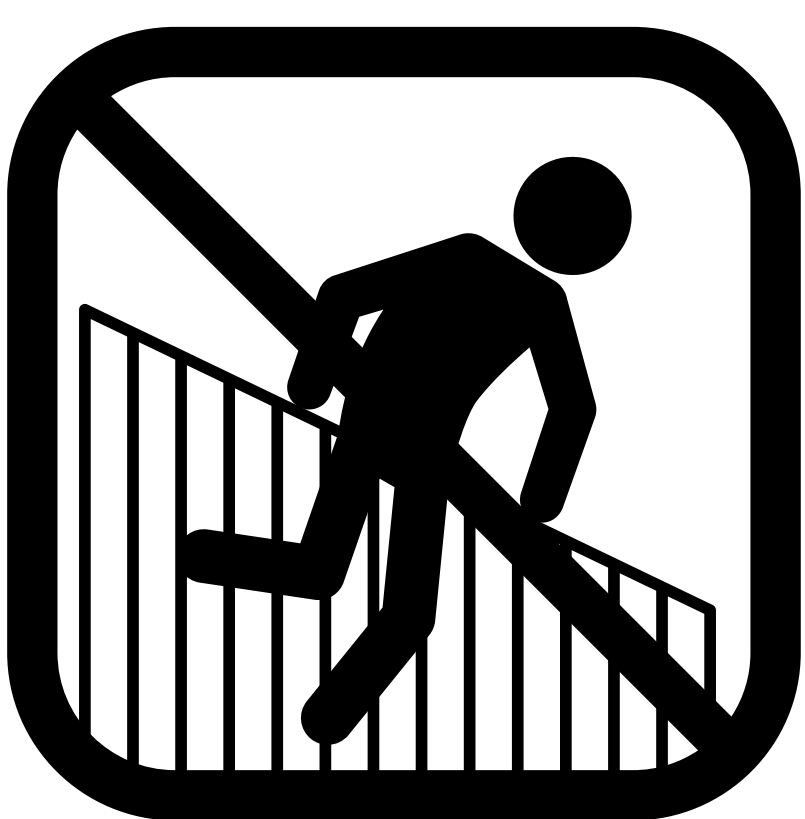
Forcering af hegn

Betaling af ovennævnte afgifter udelukker ikke anvendelse af øvrige sanktioner, erstatningsansvar og retsforfølgelse.